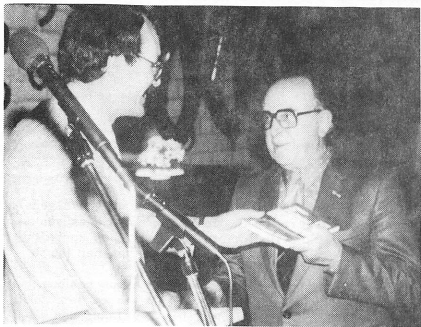
twee foto's van de jaarboekpresentatie. (Loe Giesen)