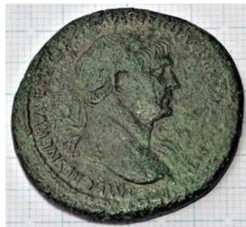
Foto: Sestertius munt gevonden nabij Putbroek (bron: Huub Schmitz)