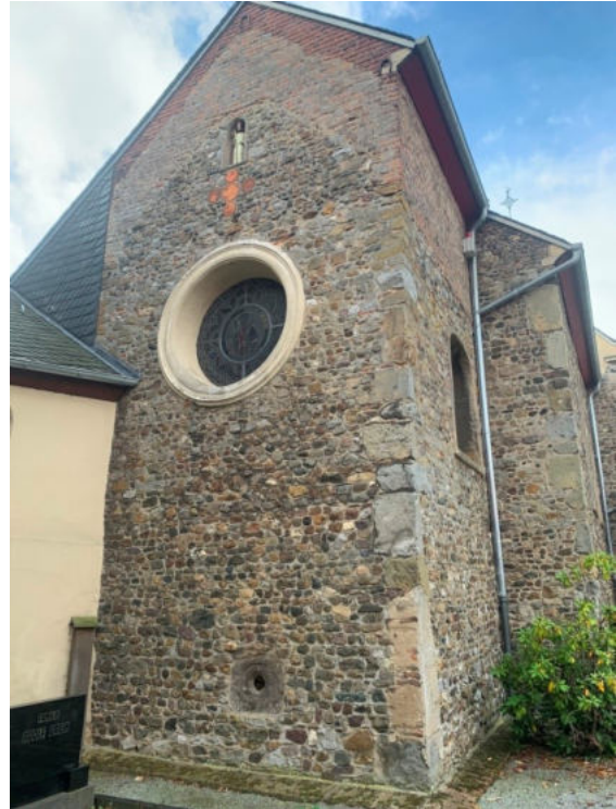
Foto: De achterzijde van de kerk te Millen. In de nok onder het beeld van St. Nikolaas zijn rode ronde Romeinse sokkelresten verwerkt.

Ga bij de splitsing in de bebouwde kom van Tüddern linksaf over de Millener Weg. Ga bij de Sittarder Straße linksaf via de straat Zur Westzipfelhalle. Aan de rechterzijde ligt Nahversorgung Tüddern met de Westzipfelhalle aan In der Fummer. Hier eindigt de terugweg (19,9 km) van fietsroute 1 Putbroek-Tüddern bij de Westzipfelhalle te Tüddern. De totale lengte van fietsroute 1 heen en terug bedraagt 34,7 km.