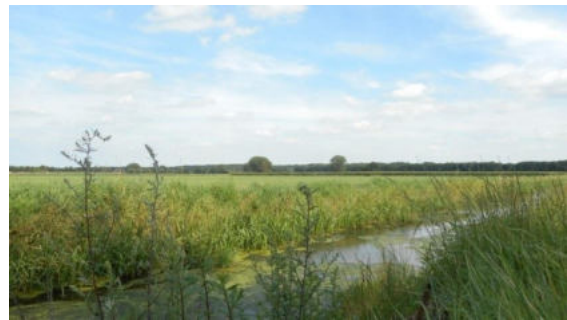
Foto: Zicht op het drassige Hohbruch nabij Schalbruch

De Annendaalderweg te Putbroek loopt over de rand van een hoogte langs een drassig gebied. Dat drassig gebied strekt zich uit van Putbroek, Echterbroek, Pepinusbroek, Haeselaarsbroek, Hohbruch, Schalbruch, Isenbruch, Millenerbruch, Schwienswei tot aan het Tüddener Fenn langs de Rodebach. Dit uitgestrekt moerassig gebied zorgde wellicht voor een natuurlijke barrière en zo tot bescherming van de vicus Tüddern tegen aanvallen vanuit het zuiden en westen.